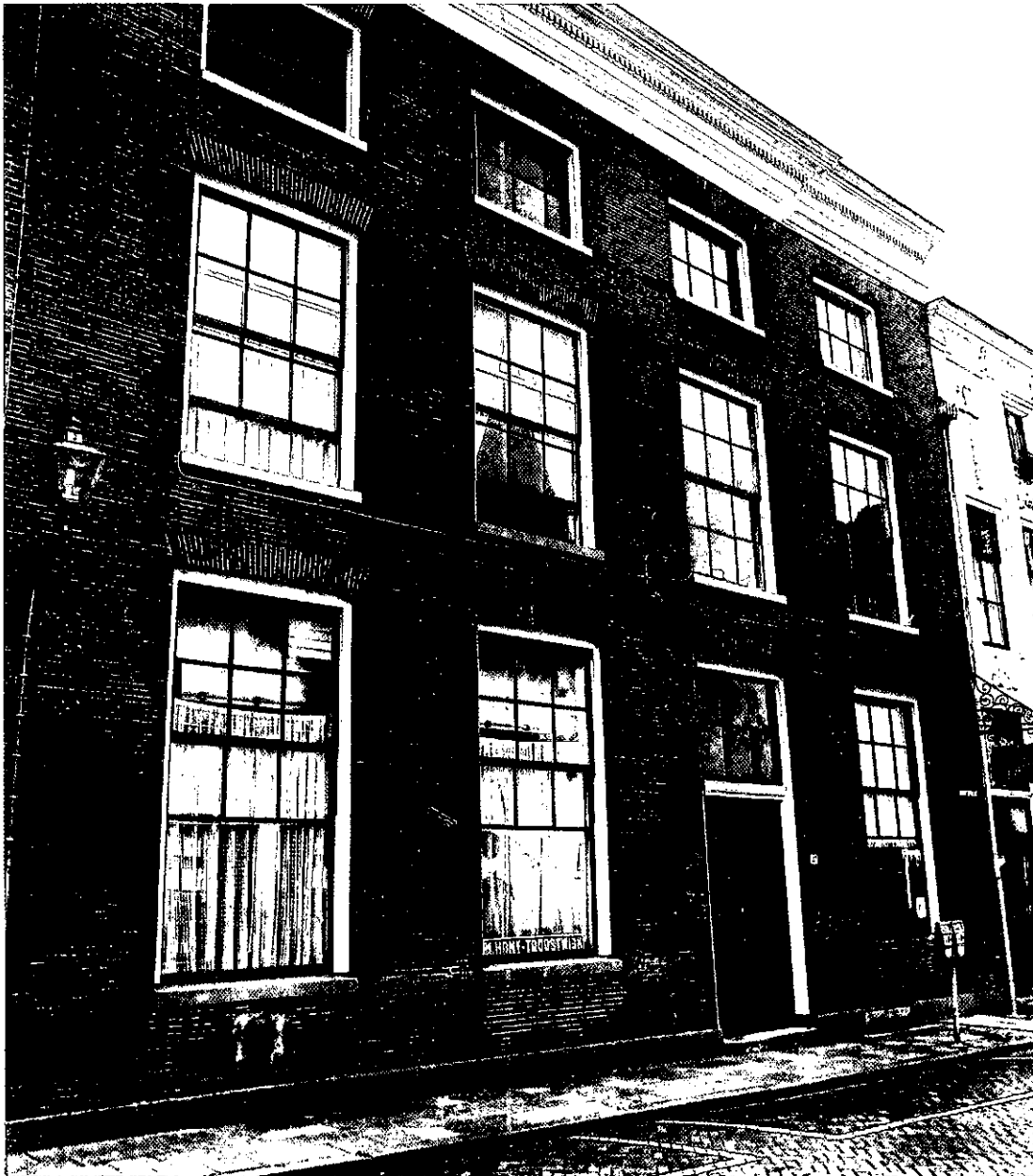
In het pand Voorstraat 41 startten in oktober 1941 de joodse scholen.